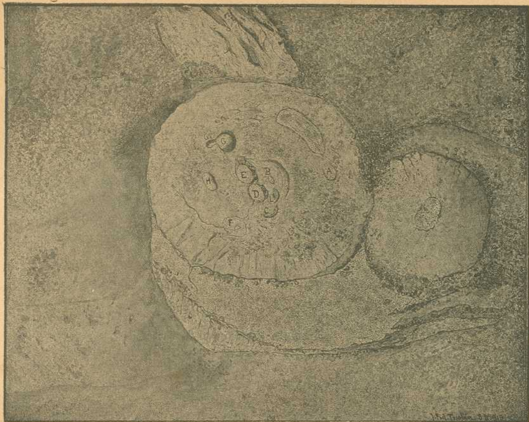
Cráter del Irazú. Aspecto general, antes de la actividad actual.—Marzo de 1917.