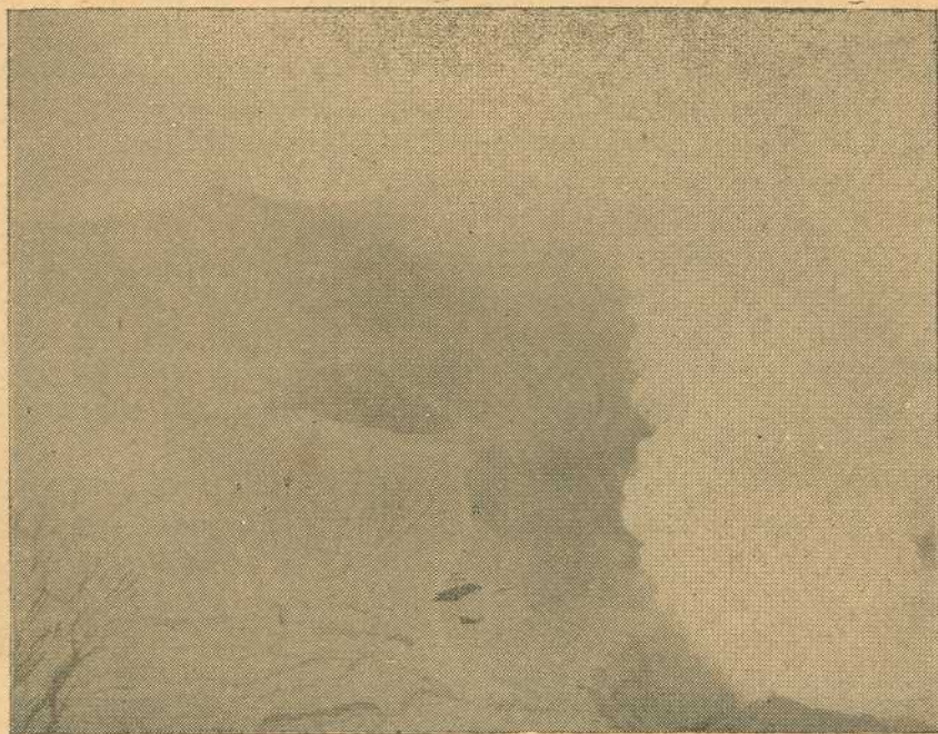
Situación del cráter "H".—27 de Agosto 920